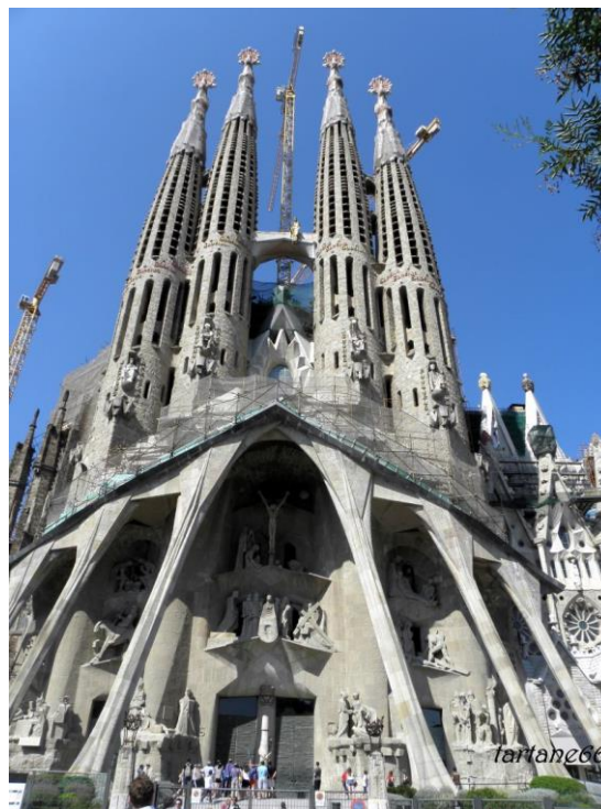
La façade de la Passion