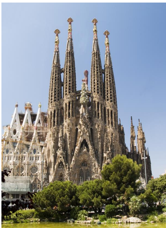
La façade de la Nativité

Comment la basilique de la Sagrada Familia , œuvre magistrale de l'architecte catalan Gaudí a t'elle changé le visage de Barcelone et l'architecture mondiale?