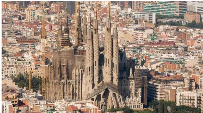
Sagrada Familia vue du ciel