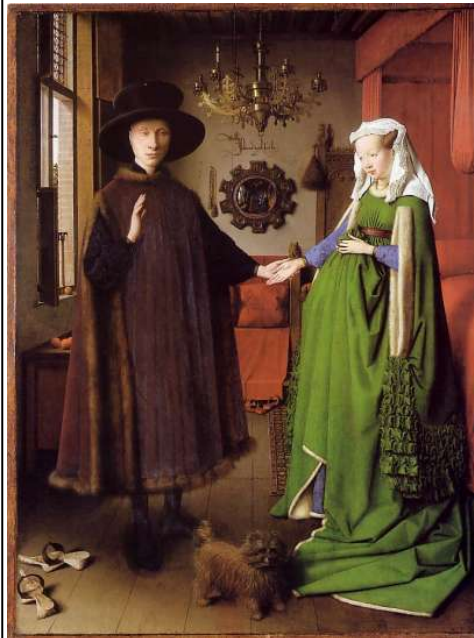
Le cadre de la scène