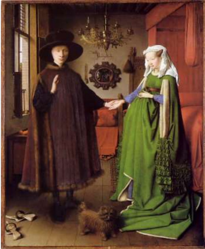
Jan Van Eyck. Les époux Arnolfini . Huile sur bois, 81,9 × 59,9 cm. National Gallery, Londres. 1434.

En quoi Les époux Arnolfini sont-ils le reflet de la puissance d'une nouvelle classe montante: la bourgeoisie?