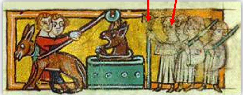
Roman de Renart Ysengrin sort du puits manuscrit du XIII s, BNF,