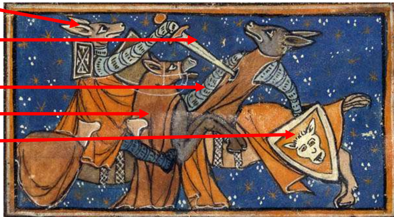
Roman de Renart Renart blesse Ysengrin en duel Miniature, XIII s, BNF, Paris