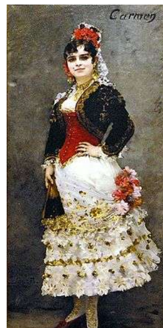
Célestine Galli-Marié qui créa le rôle en 1875

Comment les artistes se sont-ils emparé du personnage de Carmen pour en faire un mythe ?