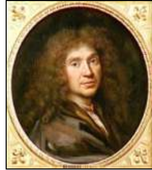
Jean-Baptiste Poquelin, dit Molière